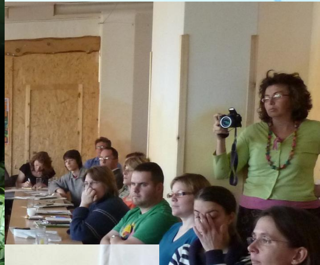
Duna TV, Családbarát, Laurán család